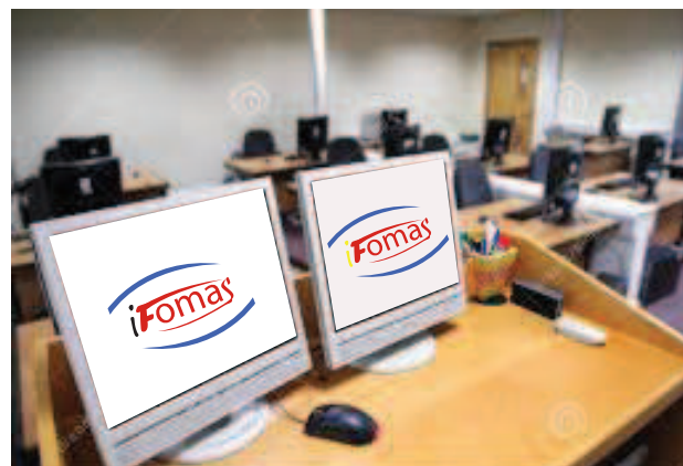
Salle des travaux pratiques d'une capacité de 25 places